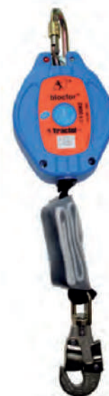
BLOCFOR™ 5/6 ESD M47-10

Connettore girevole M47 standard all'estremità dell'ammortizzatore